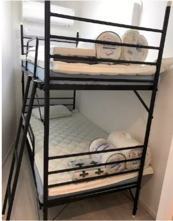
Habitaciones pequeñas (normal en Tokyo), con litera