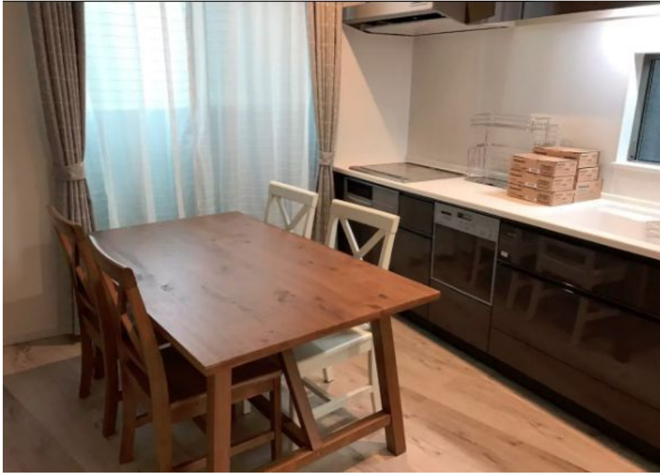
Salón-cocina con comedor